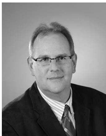
gfGR Günter Steiner Fraktionsvorsitzender