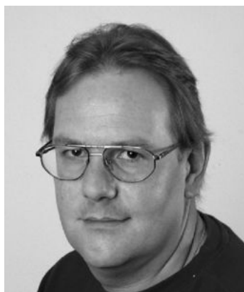
gfGR Günther Steiner Fraktionsvorsitzender