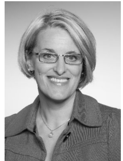
Abg. zum Nationalrat Ulrike Königsberger-Ludwig

Ich wünsche bereits jetzt ein paar ruhige, besinnliche Adventtage, ein schönes Weihnachtsfest und viel Erfolg, Zufriedenheit und Gesundheit im neuen Jahr